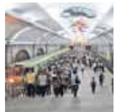
► Imagen tomada por Sun en el metro de Pyongyang.

Otro momento complicado fue cuando Sun y su grupo ya dejaban Corea del Norte. En el aeropuerto de Pyongyang los agentes norcoreanos descubrieron que alguien había robado una toalla de hotel. Pese a lo tenso de la situación, dice que no sintió miedo. "Todos los guías que nos dijeron que devolviéramos las toallas, luchaban por contener la risa. Al principio no estábamos seguros de si estaban bromeando, pero luego abandonaron brevemente el bus (para quien tuviera las toallas las devolviera de ma-