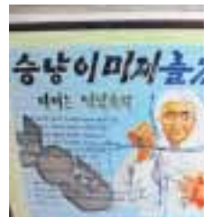
► Póster con propaganda en el hotel Yanggakdo.

nera segura) mientras sostenían nuestros pasaportes.