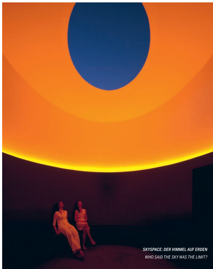
SKYSPACE: DER HIMMEL AUF ERDEN WHO SAID THE SKY WAS THE LIMIT?